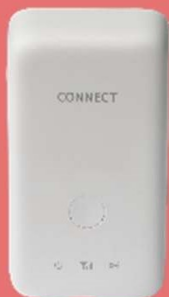
コネクトセルラー