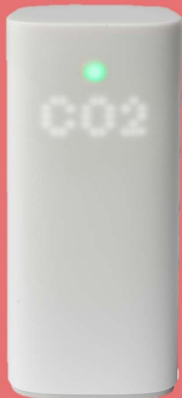
コネクトCO 2 センサ（実寸大）