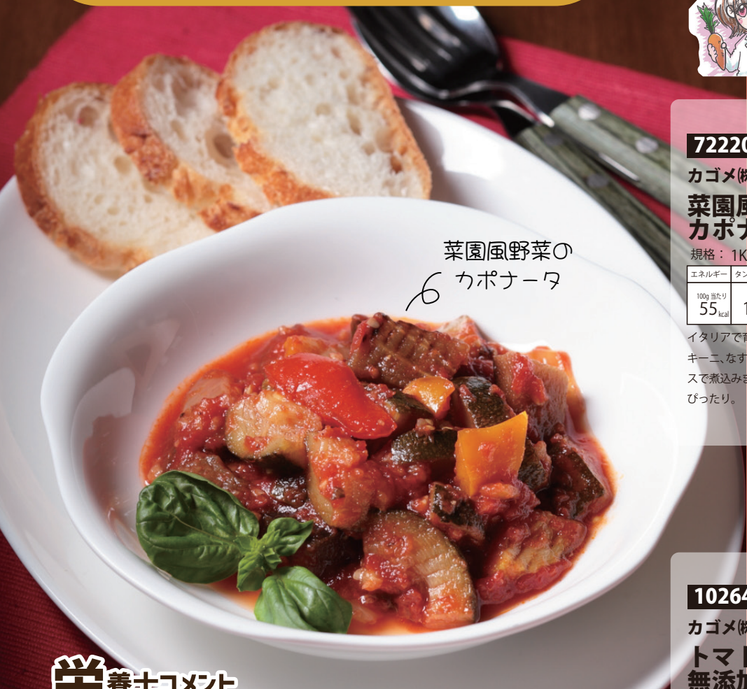
菜園風野菜の カポナータ